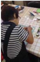
スクラップブックキング 初挑戦中...