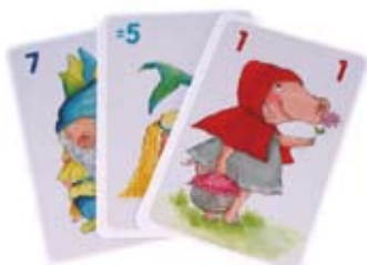
この場合7→2→3と続きます。

10にするには、11以上にならないようにはどうすればいいの？ 計算ドリルとは違った頭の使い方、足し算(引き算)を瞬時に行う必要があります。でも、きつと子どもは勉強をさせられている実感はないはず。運の要素も強いので、計算さえできれば子どもでも勝つ可能性は十分あります。遊びながら計算が出来る、家族で遊ぶにはぴったりのゲームです。お店のフリースペースで体験もできますのでご家族でお気軽に遊びにいらしてください。